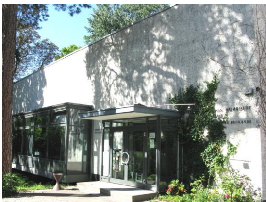
Alexander-von-Humboldt-Haus der Gesellschaft für Erdkunde, Arno-Holz-Straße 14, Steglitz