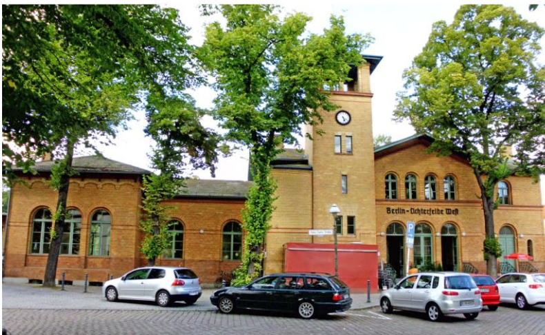
Bürgertreff im Bahnhof Lichterfelde West